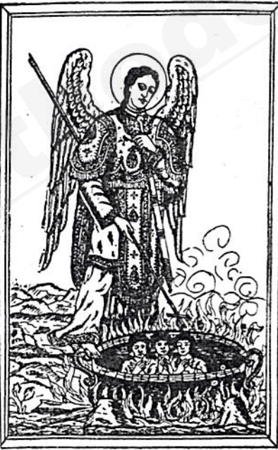
ሰዎችን ለመርዳት የሚላከው ቅገብርኤል

ገብርኤል ግለት በዕብራይስጥ “የአምላክ ሰው ወይም አምላክ ራሱን ኃያል አደረረ” ግለት ነው። በአምስተኛው ምእትን መት የነበረው ኢትዮጵያዊው ሊቅ ቅዱስ ያሬድ ደገሞ “ገብርኤል ግለት ሰውና /ሄኖክ 10:9; 20:1-8; 19:11-16-9/ በሐዲስ ኪዳን— ገብርኤል በሐዲስ ኪዳን ውስጥ በእግዚአብሔር ፊት የሚቆም መልእክተኛ ነው። /ሉቃ 1: 19/ ስለዚህ ም ከመልእክት ሁሉ የበለጠ ባለጥላይነት