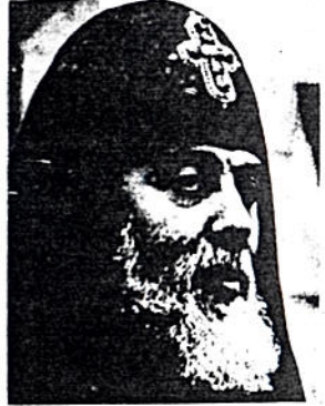
ብፁዕ ዳግማዊ ኤሊያ

ሸዋ ፡- በሸዋ ሀገረ ስብከት በሐይቆችና ቡታ ጅራ አውራጃ በዞይ ከተማ ለ3 ወራት የሙያ ግሻጃና ልግት ነክ ትምህርት ለበርካታ ከሆናት የተሰጠ መሆኑን ከተላለፈው ሪፖርት ለመረዳት ችለናል ።