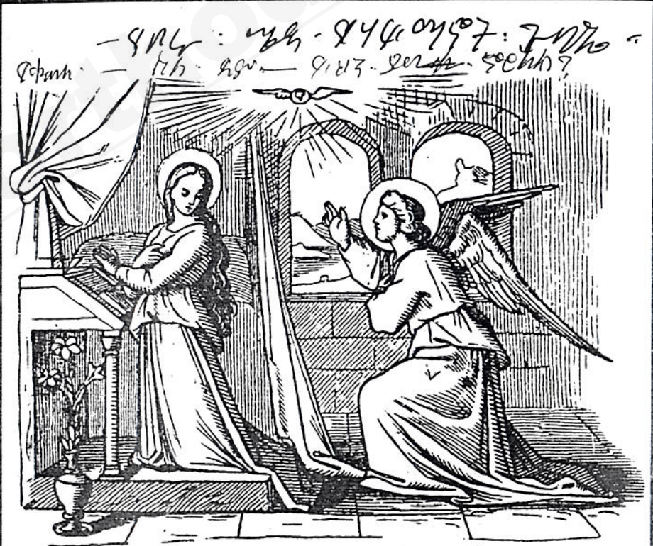
መልአኩ ቅ/ ገብርኤል ለድንግል ማርያም “እነሆ ትፀንሻለሽ፤ ወንድ ልጅም ትወልጃለሽ ስሙንም አያሱብ ትይዋለሽ” በማለት እንጸበወራት