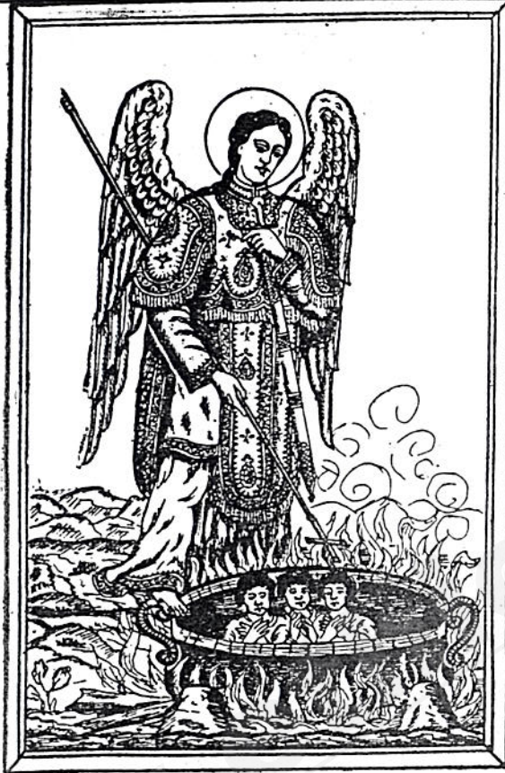
“እኔ በእግዚአብሔር ፊት የምቆመው ገብርኤል ነኝ” (ሉቃ 1: 19)