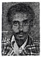
ከተገረገረ ለባዕስ ገዳሙ

ፈራሽና በሰባሽ ረጋሬ ቀሪ አላቂና ጠፊ ከንቀ ተሰባሪ ። በሆነ ሥጋ ላይ ለጊዜው ብትከብረ ። በእርቲፈሻል ጌጦች ብትሸቀረቀረ ። መሆንሽን ገምተሽ ከዚህ የማትቀረ ። በሠራሽው ሥራ ጳለ ከምታፍሪ ። ዛሬውን ተጸጸኝ ነፍሱ ተመክሮ ። ይልቅስ አስበሽ ወደፊት መጨውን ። ስለአንቺ ነፃነት የተሰቀለውን ። በረሃብና በጥም የተፈተነውን ። በሚያስደንቅ ግርግ የሚገለጠውን ። የሰውን ፊት አይቶ የማያዳለውን ። ክፋትን እንደሥራው የሚቀለውን ። ለመልካም ጽድቁን የሚያቀዳጀውን ። በሲአል ውስጥ ሆነሽ ጳለ ከመባዘን ። የጽድቅ መሠረት አርአያ በመሆን እንድታመሰግኝ ኃይሉ አምላክሽን ። በፍጹም ተሰፋ አርገሽ የማይታዩትን ። ታግለሽ ስትኖር መከራን በደልን ። በፍቅር ገንዘብ በረሀብ መፈተንን ። በእርግጥ ታግኝአለሽ የሕይወት ደገንነትን የማትጨብጨውን እንደምትጨብጨው ። የማታይውንም አርገሽ እንዳያሽው ። በተስፋ ካዳኝሽ ጌታን ከለመንሽው ። ይህን ነው አምላክሽ ከአንቺ ላይ የሚቆው በግለት ጳውሎስ እንዳስጠነቀቀሽ ። እውነት የሆነውን ቃሉን አስቀድመሽ ። የዘለዓለም ቤዛ መሆኑን ተረድተሽ ። ለሌሎችም ነፍሳት ችቦሽን አብርተሽ ። ነፍሱ ተመክሮ ቅጣትን እንዳትወርሽ መንፈስና ሥጋ የማይጣጣሙ መሆኑን ገምተሽ ። የመጨውን እንጂ የጊዜውን ትተሽ ። ከዘለዓለም ሞት ደገንነትን መርጠሽ ክፋትን ተንኩልን ወዲያ ከአንቺ አርቀሽ ። ለእኔ የሚለውን ከአእምሮሽ አውጥተሽ